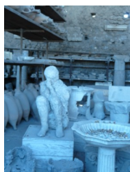
Een mens in nood: Pompeii tijdens het uitbreken van de Vesuvius