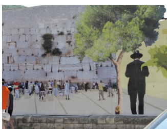
Beeld van een andere wereld: Jeruzalem; Israël

Boek met dichtelijke verwoordingen van de emoties omtrent het dreigende verlies van een vriendschap aan een sektarisch getinte structuur. Autobiografisch van Sjoukje Drenth Bruintjes. Het is te bestellen bij de uitgeverij Free Musketeers (zie google) en bij Sjoukje zelf via counselingpraktijk@planet.nl of telefonisch via nummer: 06-55168867